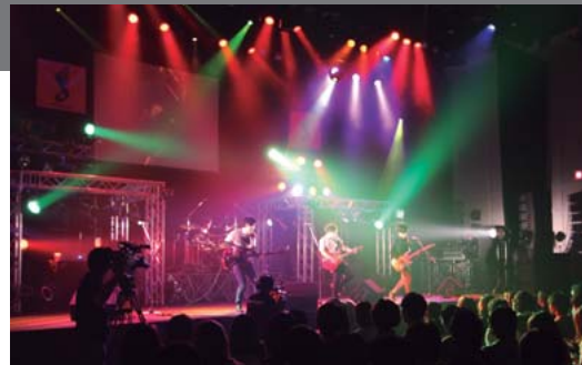
恵比寿ザ・ガーデンホールにて開催されたJAPAN FINALの様子